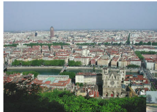
Cité Scolaire Internationale de Lyon.